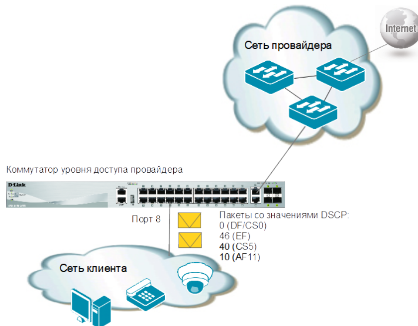
Рис. 3 Схема сети